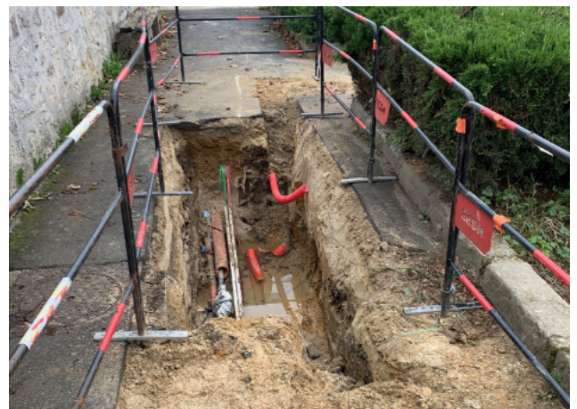
Travaux pour la mise en place du système de vidéoprotection.

À partir de ces éléments, les Voisenonais peuvent apprécier les choix opérés.