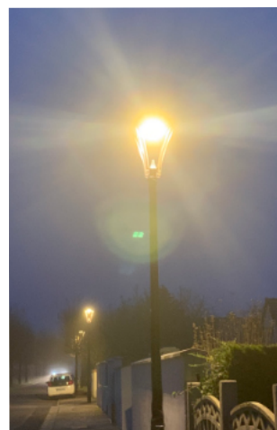
Les anciennes lampes