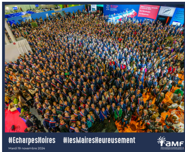
Près de cinq mille maires, venus de tout le pays, de villages comme de villes et métropoles, de toutes tendances politiques, se sont rassemblés le 19 novembre à l'ouverture du 106ème Congrès des maires et des présidents d'intercommunalité de France recouvrant leur écharpe tricolore d'une écharpe noire.

Et de préciser: « Heureusement que les communes portent les services publics de proximité et démontrent, par leur action concrète, innovante et efficace, que l'échelon local n'est pas le problème mais, au contraire, est porteur de solutions pour le pays. »