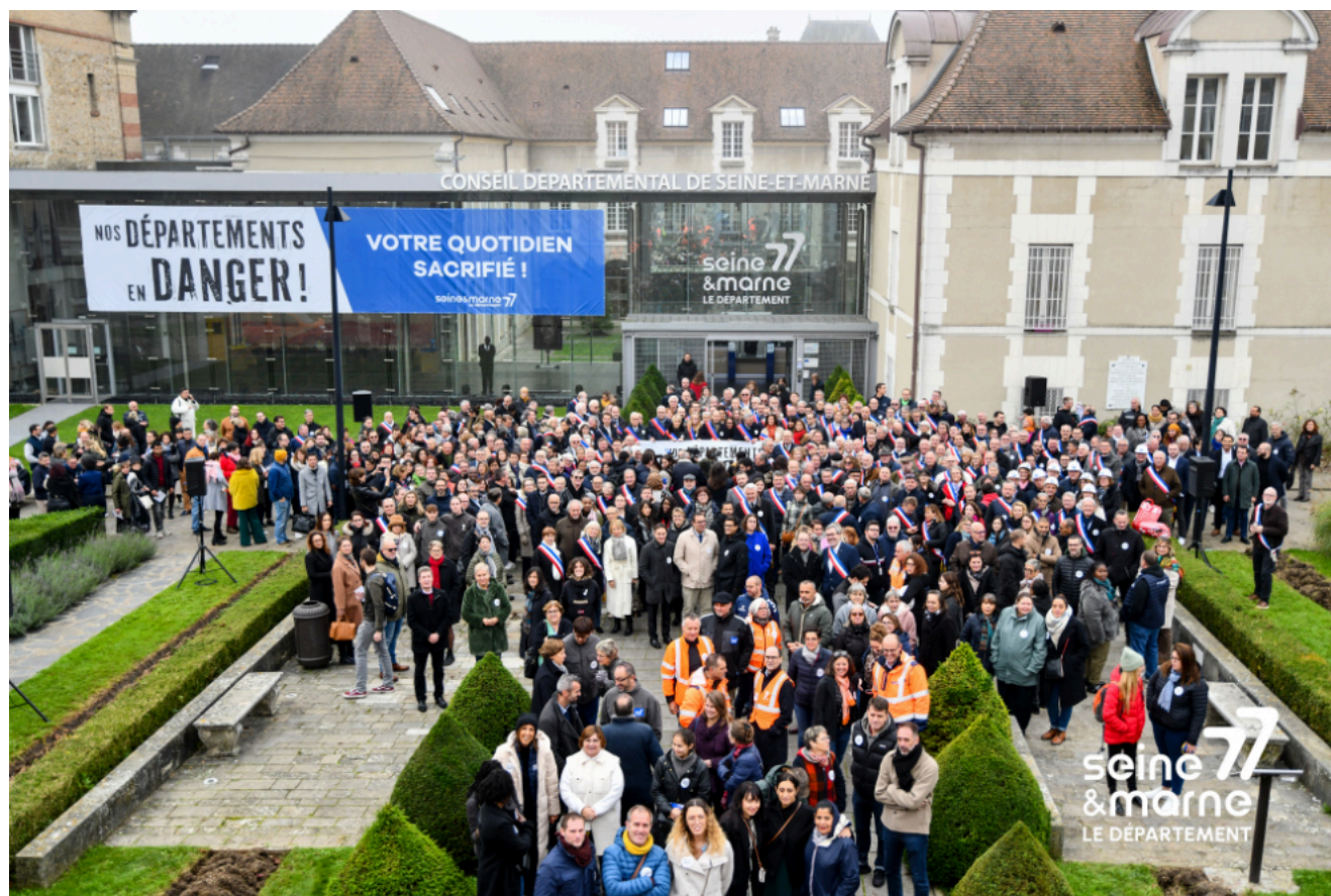
La manifestation a rassemblé près de 600 personnes.

Le Département est en effet en charge de nombreux services publics : la sûreté des routes départementales de leurs usagers, les conditions d'apprentissage des collégiens, l'accompagnement des plus fragiles (aînés, jeunes, personnes en situation de handicap), la préservation de l'environnement, le cadre de vie à travers les associations sportives et culturelles, l'aménagement du territoire aux côtés des communes.