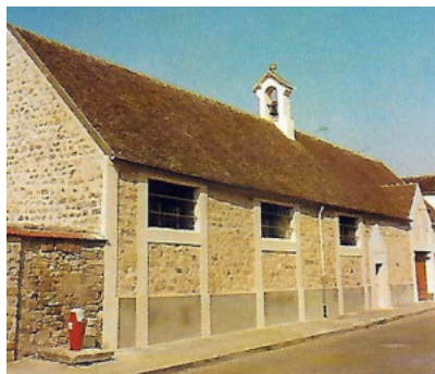
Rénovation de la façade extérieure en 1993

Claudine CARÉ, présidente 06 78 80 44 64 claudine.care-voi@orange.fr