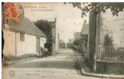
Carte postale prise entre 1905 et 1910

Sur le médaillon de la cloche est gravé : « Chapelle Saint Jean-Baptiste ».