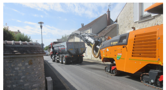
Réfection de la Rue des Écoles