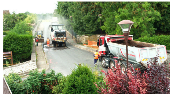
Refonte du tapis Rue de Melun, 18 juillet 2023

Au cours des mois de juin et juillet, plusieurs travaux ont été réalisés dans nos rues. Bien qu'ils provoquent quelques contrariétés et nuisances pendant leur réalisation, les services de voiries font leur possible pour qu'ils soient les plus brefs possible. Avec, à la clé, un village entretenu et une vie quotidienne améliorée.