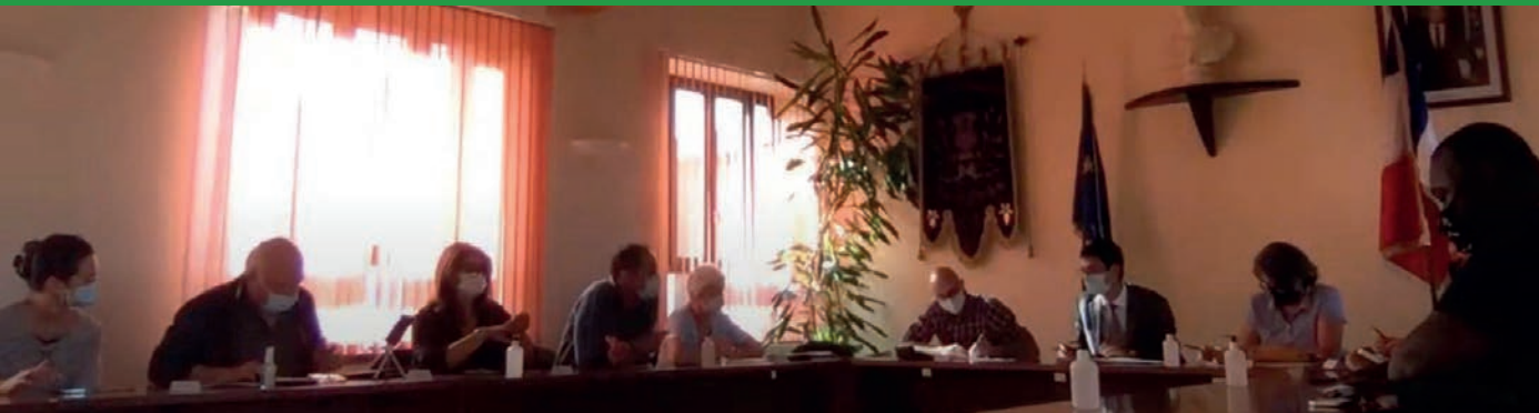
Les élus du Conseil municipal lors d'une séance publique