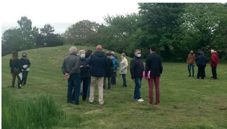
Réunion des lotissements du « Hameau du Jard » et de « La Plaine du Jard »

Une invitation officielle est adressée aux riverains du quartier concerné quelques jours avant la réunion.