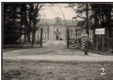
Photo 2, le fronton du portail et les lanternes ont été retirés, sans doute pour permettre l'entrée des engins, la pancarte Schloss Kaserne (traduction : la caserne du château) a été déplacée à droite et une guérite installée.

Photo 1, La grille du château est complète. Présence de lanternes de chaque côté. L'allée est brute. L'espace en herbe ne comporte pas de décor.