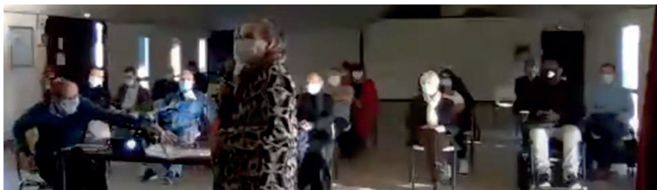
Réunion publique à Voisenon

Qu'en matière de participation à la vie de la cité, chacun a sa place ! Ce n'est pas réservé à celles et ceux qui savent parler, écrire ou s'exprimer, encore moins à des spécialistes. Tout le monde a des idées sur ce qu'est son quotidien et sur ce qu'il pourrait être. Ce n'est qu'avec les Voisenonais que nous pourrions réaliser l'avenir du Voisenon que nous aimons. C'est une responsabilité qu'ils partagent avec les élus, au service d'une société plus juste, plus solidaire et plus transparente.