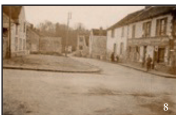
Photo 8, un soldat allemand devant le café des Closeaux au croisement de la rue Grande et de la rue des Closeaux.

maison du gardien (actuellement occupé par le petit pavillon phénix et le terrain de basket. La photo 5 (Mise en vente sur un site d'enchères par un antiquaire allemand). Au dos écrit au stylo vert : Voisenon Villa Rouge April-mai 41. Probablement une photo prise par un soldat allemand.