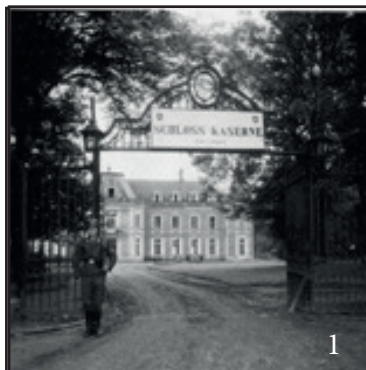
Photo 1, La grille du château est complète. Présence de lanternes de chaque côté. L'allée est brute. L'espace en herbe ne comporte pas de décor.

Dernièrement le fruit des recherches de Guillaume COISON et Patrick KRAKOWSKI sur Internet ont enrichi les archives de l'association. Ces photos sont très intéressantes :