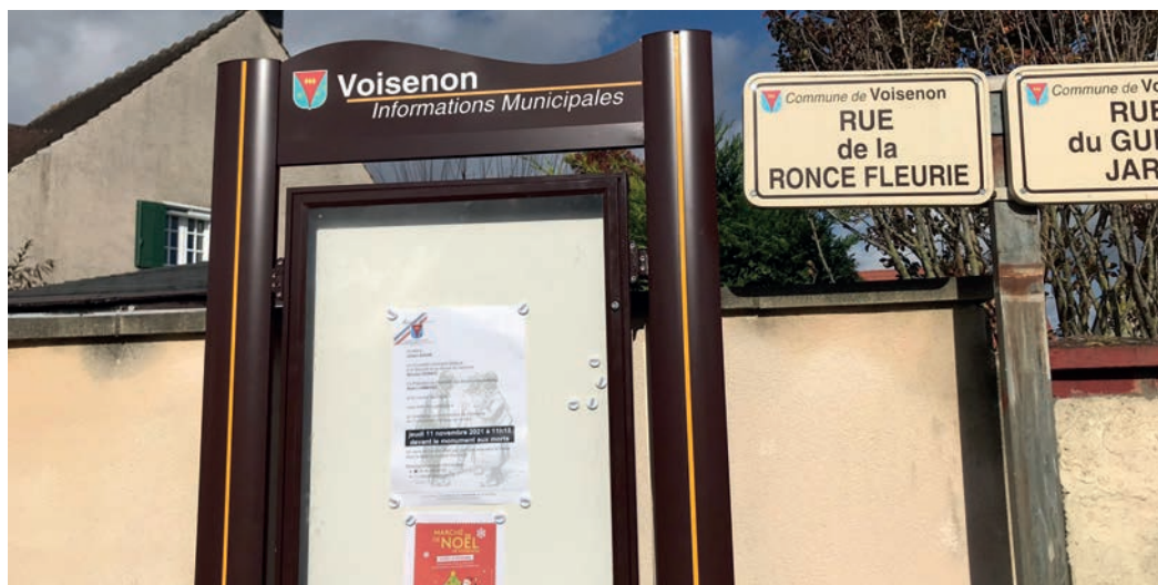
Les nouveaux panneaux d'affichage installés par la mairie facilitent la communication

Je considère que le citoyen n'est pas un consommateur. C'est un producteur d'idées, de convictions, d'engagement et de solidarité. Il est de notre devoir collectif de faire que chaque citoyen soit un créateur trouvant des solutions au bénéfice de son village.