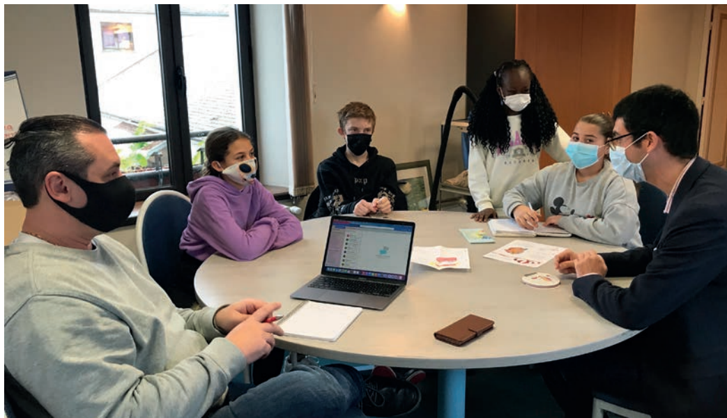
Réunion du Conseil municipal des jeunes réunis autour de Monsieur le Maire et de son adjoint