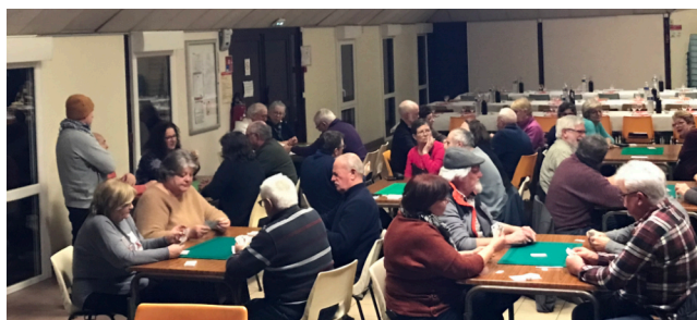
Autres photos en page associations