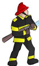
Schéma communal de défense extérieure contre l'incendie (DECI)

Le schéma communal de Défense Extérieure Contre l'Incendie (DECI) vient d'être finalisé. Ce document technique contribue à l'identification des risques, à l'analyse du besoin, au recensement et au contrôle des dispositifs de ressources en eau à disposition des services de secours. Il induit la détection d'éventuelles anomalies. Son étude favorise la planification des améliorations en matière de défense extérieure incendie par anticipation et pour une meilleure gestion des coûts. Il n'est pas obligatoire, mais il traduit la volonté de vos élus d'agir au quotidien pour la sécurité des biens et des personnes sur l'ensemble du territoire communal. La connaissance du terrain, des moyens et des besoins contribuera à réduire les risques liés à votre sécurité en matière de protection incendie. Telle est l'ambition de l'équipe municipale.