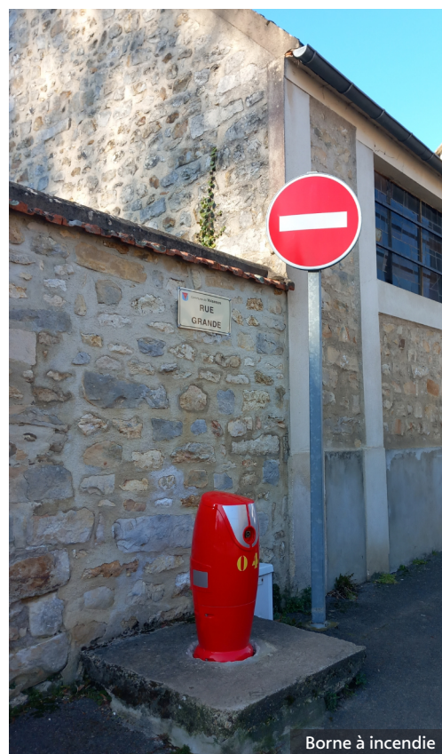
Borne à incendie

Oui tout à fait. Il s'agit de plans d'eau naturels identifiés sur la commune : place du 14-Juillet (l'abreuvoir) et dans l'enceinte du collège Nazareth La Salle notamment. Ces réserves d'eau sont précieuses pour les pompiers car en cas d'intervention ils peuvent puiser pour remplir une citerne afin de lutter contre un incendie.