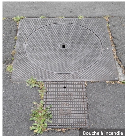
Bouche à incendie