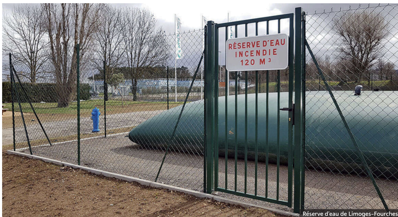
Réserve d'eau de Limoges-Fourches

Ces investissements peuvent être pris en charge par l'agglomération, mais pas l'acquisition et l'installation du poteau incendie qui est à la charge de la collectivité. Le financement de ces équipements peut être éventuellement subventionné par l'Etat dans le cadre de la dotation DETR (Dotation d'Équipement des Territoires Ruraux).