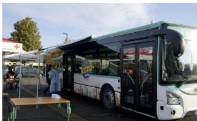
Le bus de dépistage a fait escale à Voisenon

Le bus mis en place par la Région est passé par Voisenon, jeudi 22 octobre pour effectuer des tests PCR gratuits de dépistage du Covid-19, sur le parking du mille-club. « Dans ces bus, nous pouvons réaliser jusqu'à