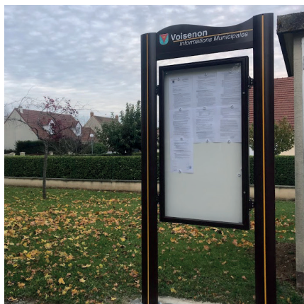
Nouveaux panneaux : Les Noyers Dorés, Le Hameau du Jard, Les Chaumières, Chemin du Moulin et Le Plaine du Jard

Nous vous rappelons que pour toute demande d'affichage sur la commune, vous devez adresser une demande écrite à Monsieur le Maire.