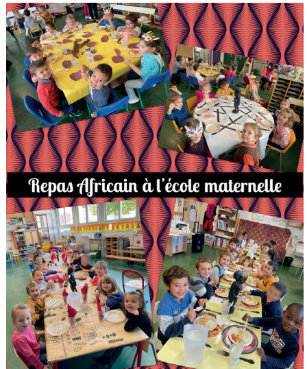
Repas Africain à l'école maternelle

Cette année, l'école maternelle de Voisenon travaille autour de la thématique de l'Afrique. La première période s'est achevée par la confection de mets africains que les enfants ont pu déguster sur un temps méridien avec les enseignants, les ATSEM et les animateurs de cantine. Tout le monde s'est régalé !